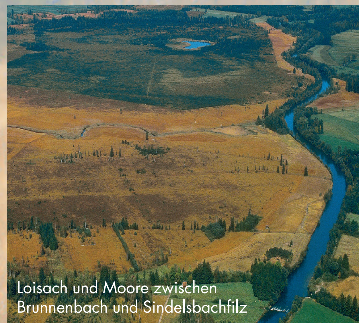
Loisach und Moore zwischen Brunnenbach und Sindelsbachfilz

... erstrecken sich entlang der Loisach vom Kochelsee bis Penzberg. Mit über 4.000 ha Ausdehnung gehören sie zu den größten zusammenhängenden Feuchtgebieten Deutschlands. Sie bilden den südlichen Teil der rund 40 km langen und europaweit bedeutsamen „Tölzer Moorachse“.