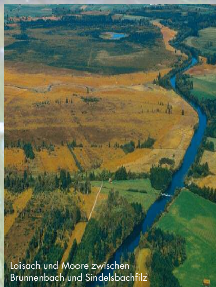
Loisach und Moore zwischen Brunnenbach und Sindelsbachfilz

Sie befinden sich in einem der letzten Refugien der