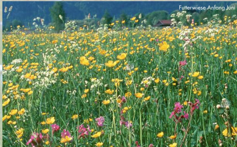
Futterwiese Anfang Juni