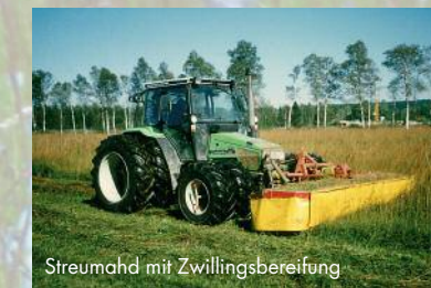
Streumahd mit Zwillingbereifung

Die Bauern pflegen die Kulturlandschaft bis heute: Werden Feucht- und Streuwiesen nicht gemäht, siedeln sich nach und nach wieder Bäume an und die Niedermoorlandschaft bewaldet sich aufs Neue.